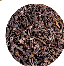
Hrubé větve a kletší