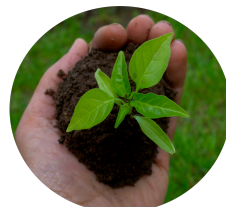
Sazenice a semena