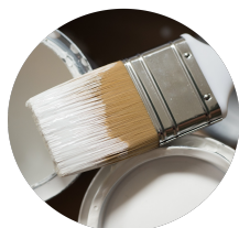
Lazura - atest